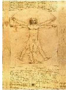
Léonard De VINCI