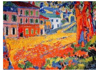
Maurice de VLAMINCK