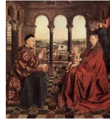
Jan VAN EYCK