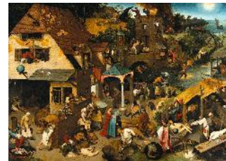
Pieter BRUEGHEL l'Ancien