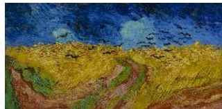
Vincent VAN GOGH