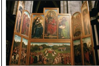
Hubert et Jan VAN EYCK